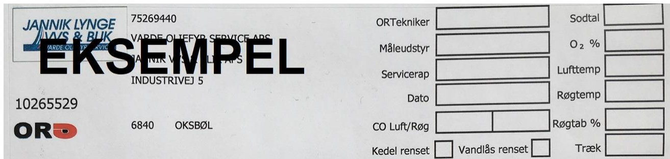
FIGUR 1 EKSEMPEL PÅ OR-MÆRKAT

Der opsættes et mærkat på alle anlæg, som skorstensfejeren kan følge op på eller, i tilfælde af manglende/forældet mærkat, kan tilbyde energimåling udført ved den lovpligtige skorstensfejsning.