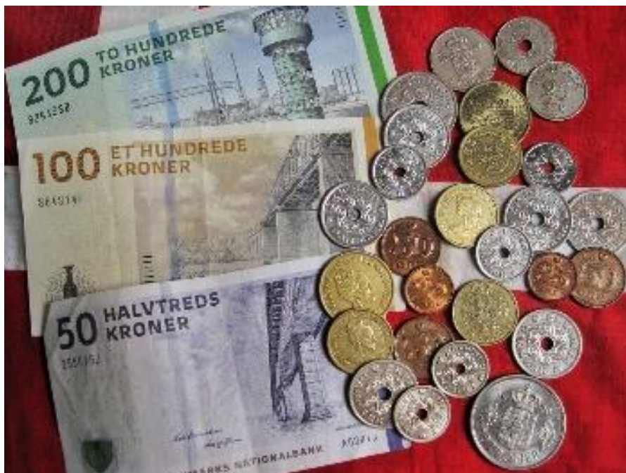
Håndteringen af kontanter i virksomheden er blevet strammet op.